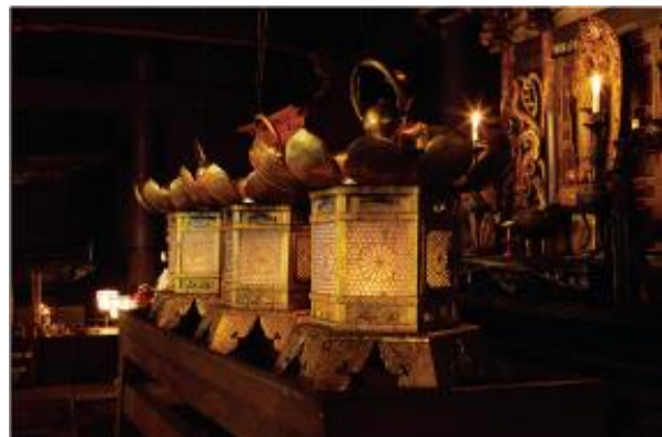
▲1200年灯り続ける不滅の法灯