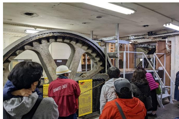
▲坂本ケーブルの巻上げ室