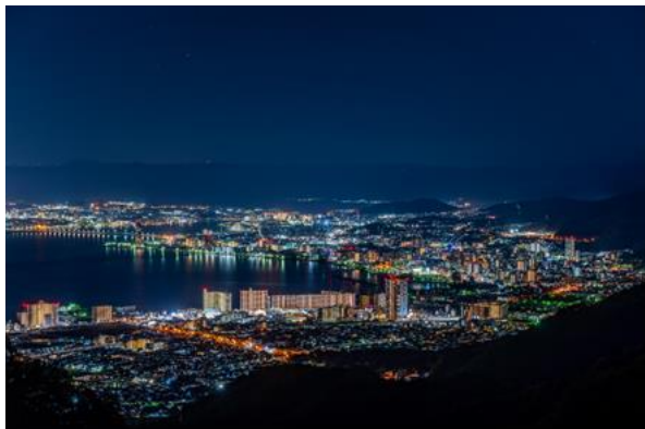
▲比叡山から望む夜景（大津市街地方面）