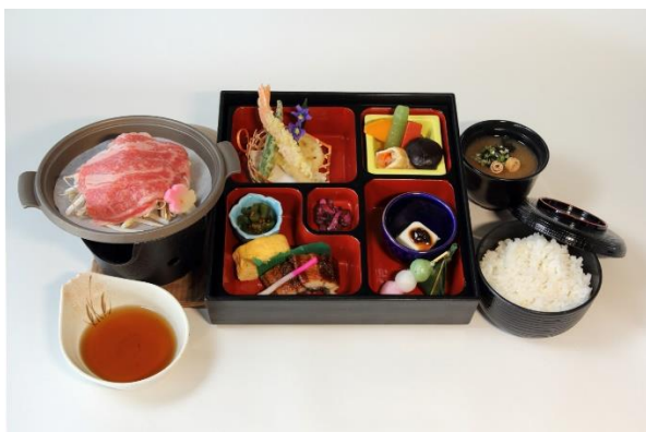
▲峰道レストランのお食事