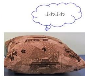
座席シートモケットクッション