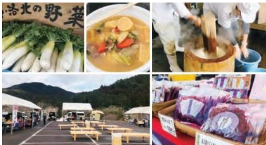
マルシェ(イメージ)