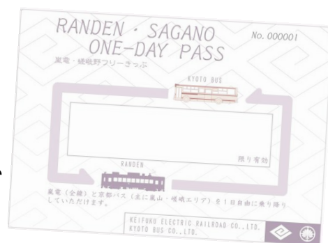
▲嵐電・嵯峨野フリーきっぷ