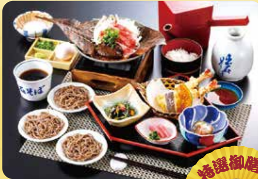
【昼食】いずし堂 皿そば御膳「仙石」

出石の皿そば、但馬牛の朴葉みそ焼きなどがセットになったツアー特選の昼食と、ご参加の方に豪華プレゼントをご用意いたします。