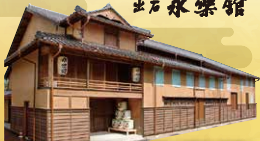
出石を彩る近畿最古の芝居小屋「永楽館」